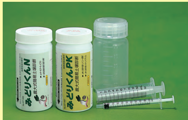
▲「みどりくん スターターキット」