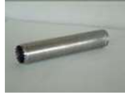
採土管（山形刃付き） φ50×300 用