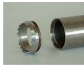
刃先を分離した状況