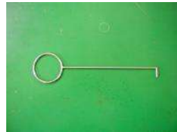
試料引揚治具 採取途中で引き揚げる際に使用します。