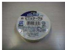
ビニールテープ 試料の封に使用しま