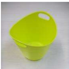
洗浄容器 刃先等の洗浄に使用します。