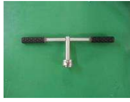
ハンドル ロングタイプ ハンドルシャフト