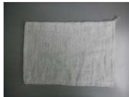
雑巾3枚 洗浄後の拭取りに使用します。