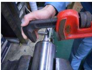
万力などで固定する