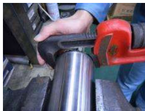
パイプレンチで廻す